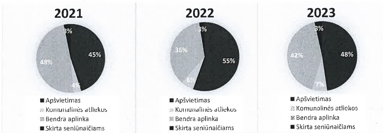
1 pav. 2021–2023 m. biudžeto lėšų panaudojimas (remiantis 1 lentelės duomenimis)